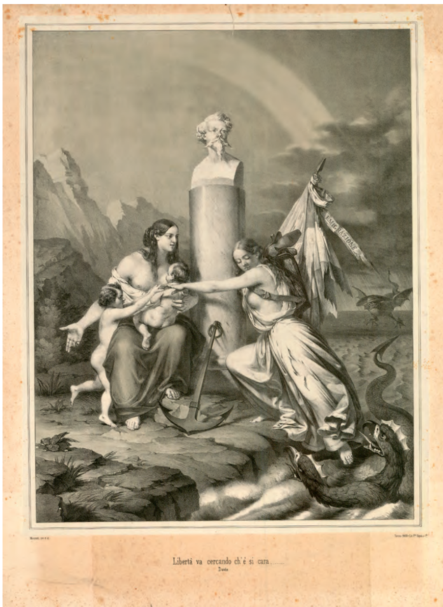
Fig. 4. Antonio Masutti (inventore), Mazzutti (incisore), Libertà va cercando ch'è sì cara... Dante, 1859, su concessione della Civica Raccolta delle Stampe Achille Bertarelli di Milano, A.S. g 12-19.