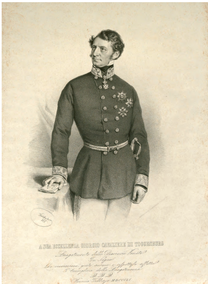
Fig. 3. Josef Kriehuber (litografo), A Sua Eccellenza Giorgio cavaliere di Toggenburg, Luogotenente delle Provincie Venete , litografia, 1855, su concessione del Wien Museum, Inv.-Nr. W 6520, CC0.