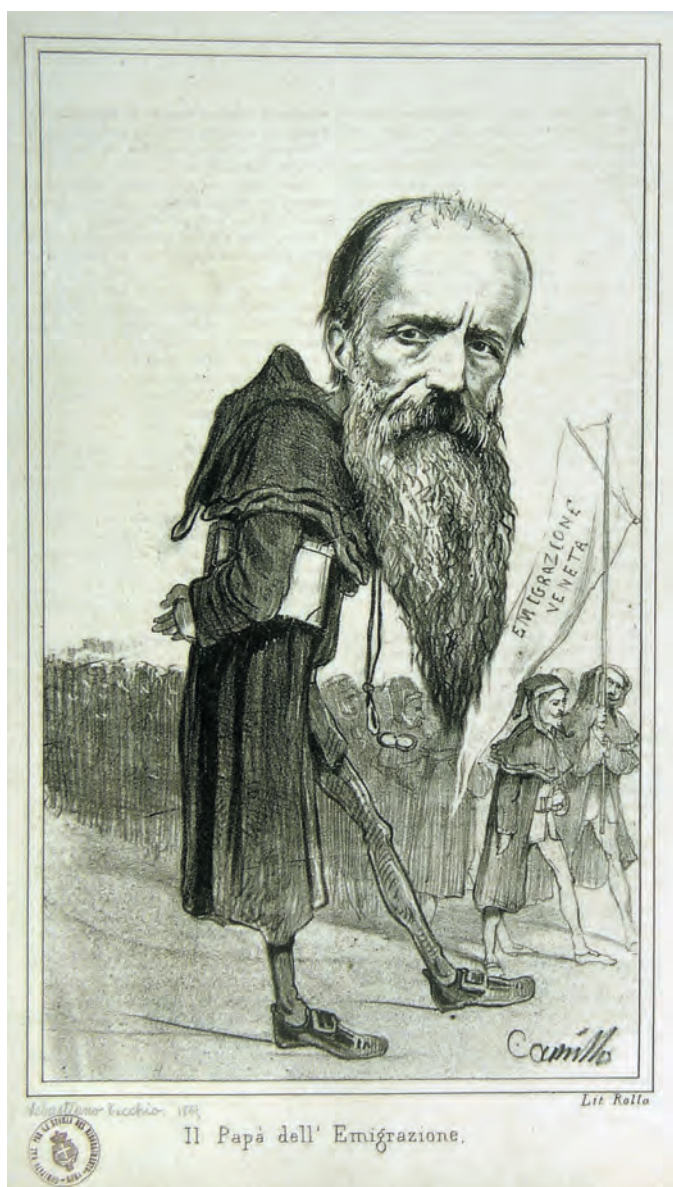
Fig. 7. Camillo Marietti (inventore), Rolla (litografo), Il Papà dell' Emigrazione – Sebastiano Tecchio, su concessione del Museo Centrale del Risorgimento di Roma.