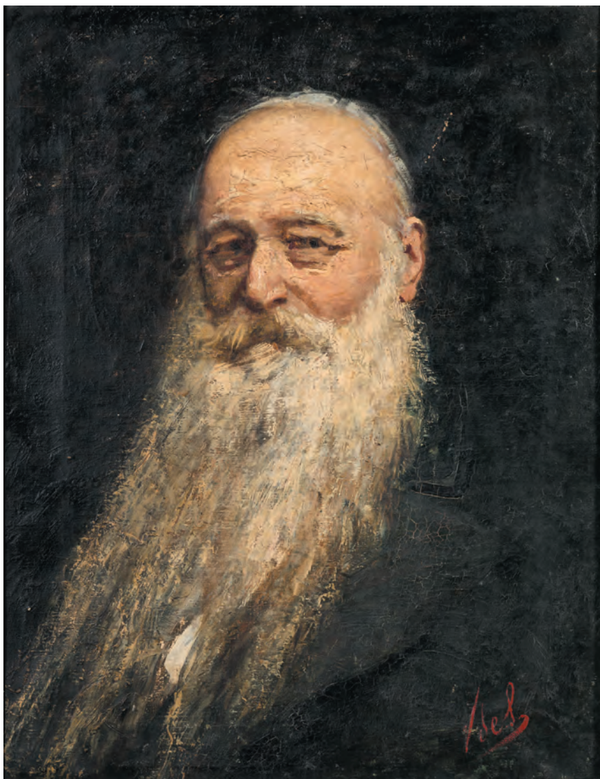
Fig. 6. Vincenzo De Stefani, Ritratto di Sebastiano Tecchio , olio su tela, 1884, su concessione dei Musei Civici di Verona, Galleria d'Arte Moderna Achille Forti (Gardaphoto, Salò).