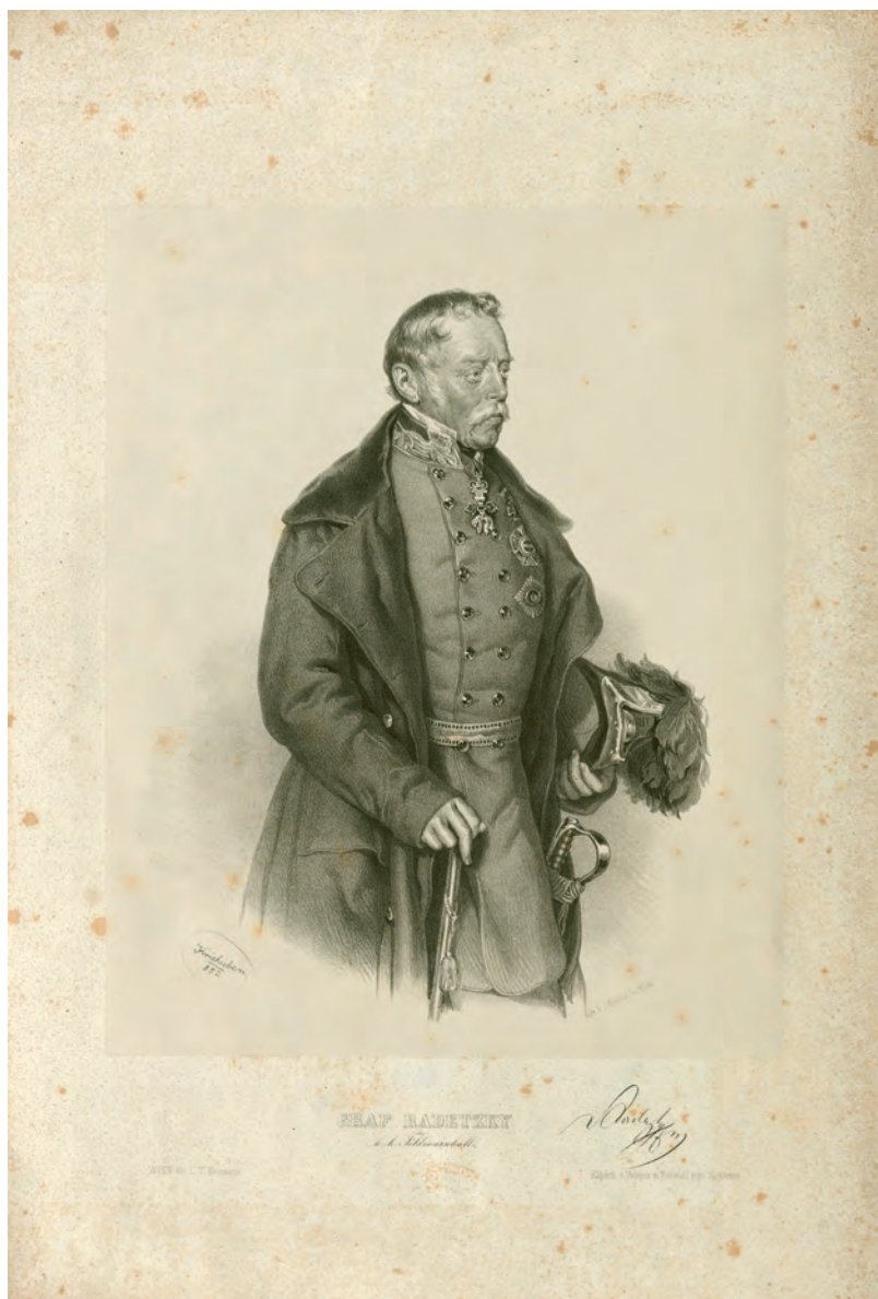
Fig. 1. Josef Kriehuber (litografo), Johann Höfelich (incisore), Graf Radetzky k. k. Feldmarschall , litografia, 1852, su concessione del Wien Museum, Inv.-Nr. W 5355, CC0.