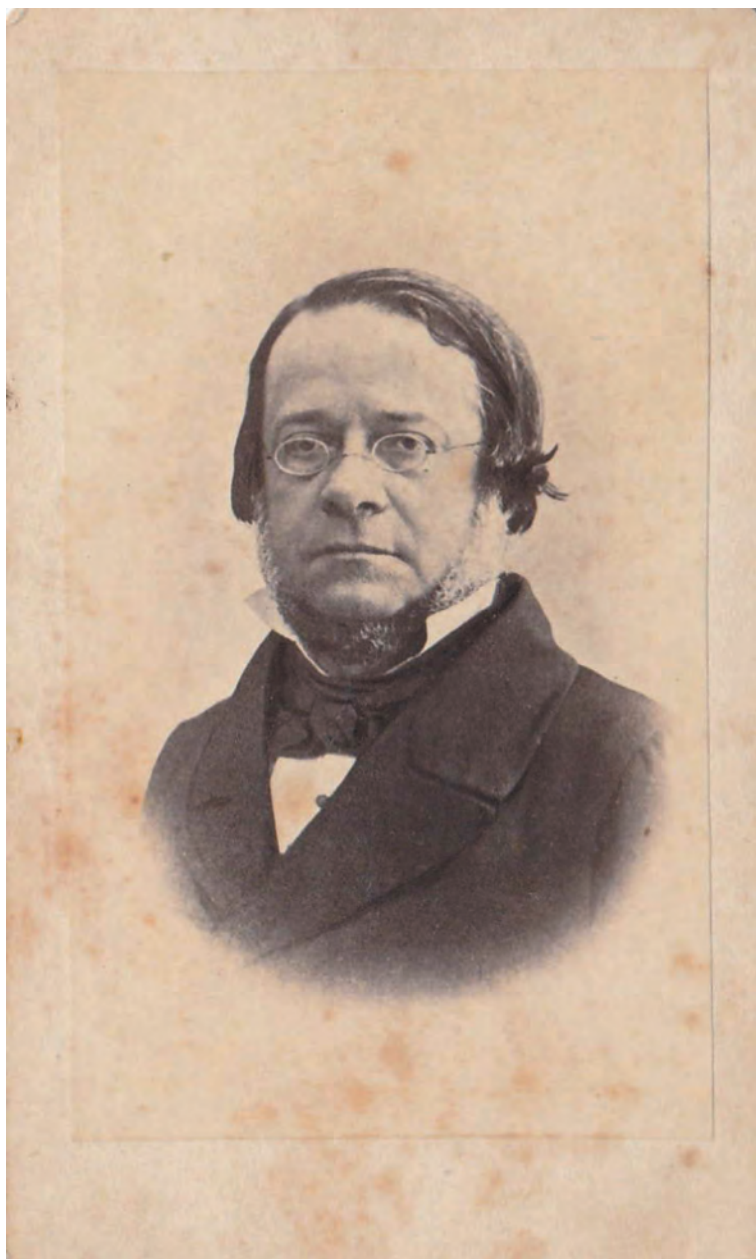
Fig. 11. Ritratto fotografico di Daniele Manin , 1856, Collezione privata.