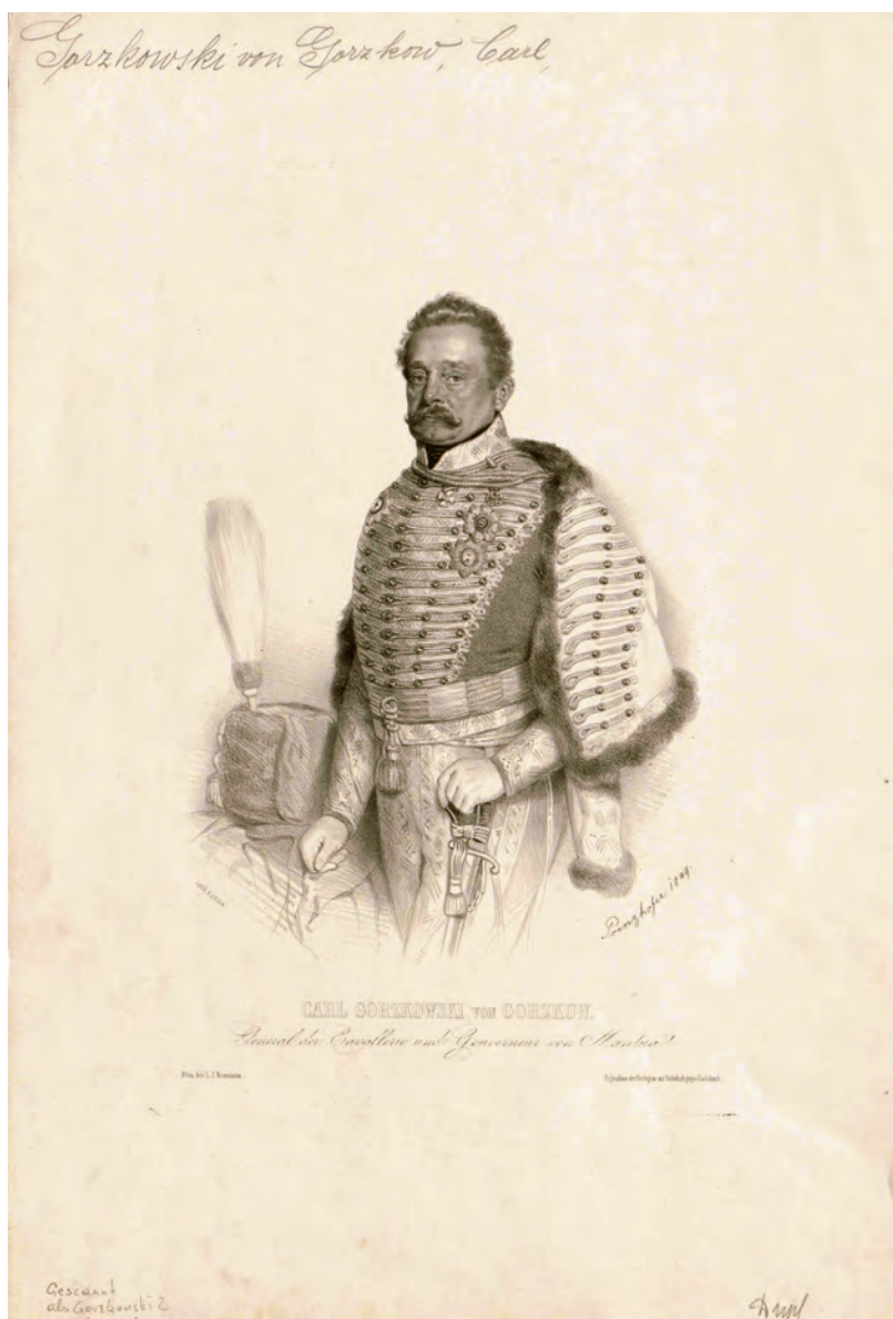
Fig. 2. August Prinzhofer (litografo), Carl Gorzkowski von Gorzkow. General der Cavallerie und Gouverneur von Mantua , litografia, 1849, su concessione della Österreichische Nationalbibliothek in Wien, PORT_00100159_01 POR MAG.